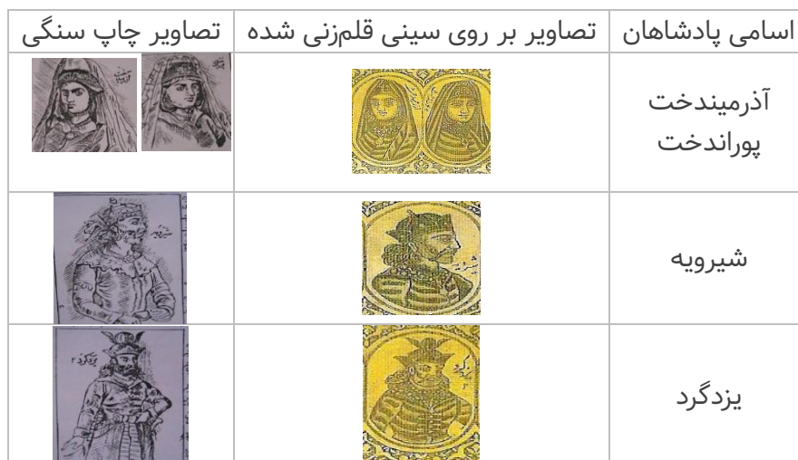
جدول ۲. مقایسه تصاویر کتاب چاپ سنگی نامه خسروان با سینی برنجی دوره قاجار

زندگی پادشاهان شاهنامه است که توسط جلال‌الدین میرزا انجام گرفته است. جلال‌الدین میرزا در این کتاب پادشاهان قدیمی ایرانی را در ردیف پیامبران قرار داده و بسیاری از آن‌ها را صاحب دو مقام پادشاهی و پیامبری می‌داند که بر آن‌ها از آسمان کتاب نازل شده است (بیگدلو، ۱۳۸۰: ۵۵ - ۵۴). در جدول ۱، مشاهده می‌گردد که شباهت بسیاری بین تصاویر کتاب و ظرف مورد نظر این پژوهش وجود دارد. از آنجاکه قیاس تمام تصاویر امکان‌پذیر نبود، تطبیق تصاویر آزمون‌دخت و پوران‌دخت، شیرویه و یزدگر برای نشان دادن شباهت میان ظرف و کتاب مذکور به نظر کافی رسید.