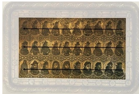
شکل ۴. زمینه سینی، تصاویر پادشاهان و جهت خوانش تصاویر