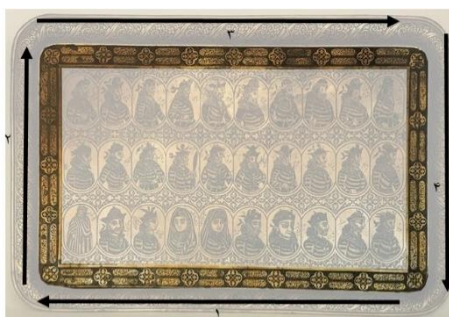
شکل ۳. حاشیه دوم سینی فلزی و جهت متن کلامی