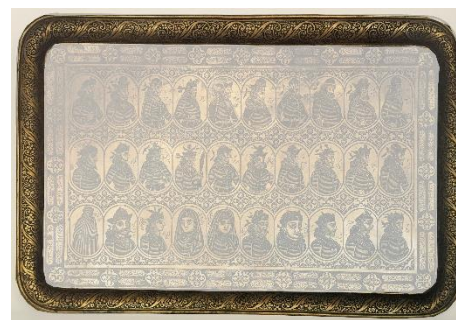
شکل ۲. حاشیه نخست سینی برنجی

هرمز، بهرام، بهرام ۲، بهرام ۳، نرسی، هرمز، شاپور ۲، اردشیر ۲. در ردیف دوم: شاپور ۳، بهرام ۴، یزدگرد، بهرام ۵، یزدگرد دوم، هرمز ۳، فیروز، پلاس، غباد، انوشیروان. در ردیف سوم: هرمز ۴، خسرو، شیرویه، اردشیر، شهروراز، پوراندخت، آرمیدخت، فرخ‌زاد، یزدگرد ۳، عمر بن خطاب. در مابین قاب‌ها نشان‌های اسلیمی قرار گرفته است (شکل ۴).