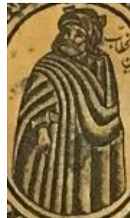
شکل ۵. جزئی از تصویر، عمر الخطاب

و ۵۲ انسان دیگر به عنوان انسان‌هایی قرار گرفته‌اند که به دلیل کارهای عظیمی که انجام داده‌اند، در جهان مشهورند و آخرین تصویر از این انسان‌های بزرگ به ناپلئون اختصاص دارد. ولیکن در نمونه ۳، تصاویر پادشاهان ایران باستان که در شاهنامه الخسروان مصور شده است نیز مشاهده می‌گردد. پادشاهان مصور شده در این قالیچه‌ها، از کیومرث آغاز شده تا یزدگرد سوم، البته در کنار این افراد، تصاویری از پادشاهان پس از اسلام چون نادرشاه، ناصرالدین شاه، احمدشاه قاجار و ... نیز دیده می‌شود. تصویر عمر بن الخطاب در هر سه قالیچه شباهت بسیار به تصویر حاکمی شده بر سینی فلزی دارد. به نظر می‌رسد یکی از منابع الهام سینی مورد پژوهش، قالیچه‌های تصویری است که در دوره قاجار به تعداد زیاد بافته می‌شود.